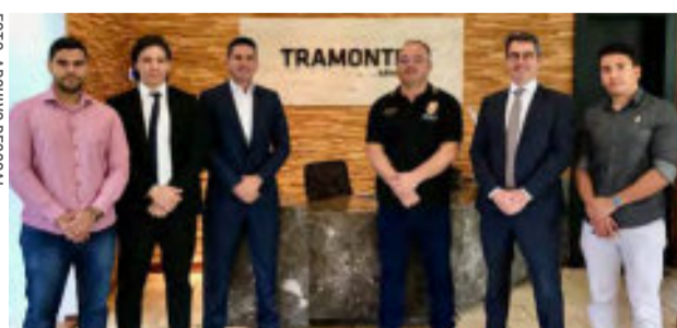
Diretoria cumpre cronograma de visitas