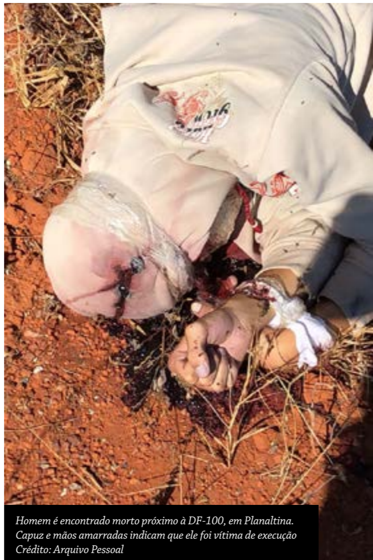
Homem é encontrado morto próximo à DF-100, em Planaltina. Capuz e mãos amarradas indicam que ele foi vítima de execução

Todas essas situações demonstram a falência da Segurança Pública no governo Rollemberg (PSB) e são resultado claro do desinteresse do GDF em investir adequadamente na área. Com informações do Metrôpoles