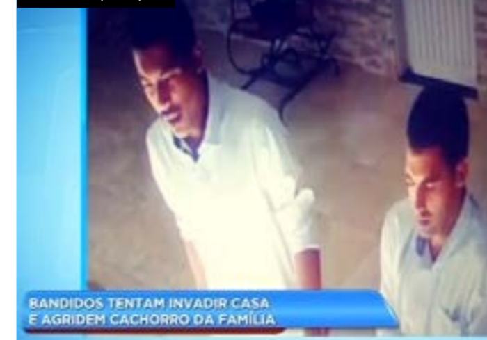
BANDIDOS TENTAM INVADIR CASA E AGRIDEM CACHORRO DA FAMÍLIA